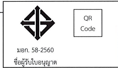
สิ่งหุ้มห่อ